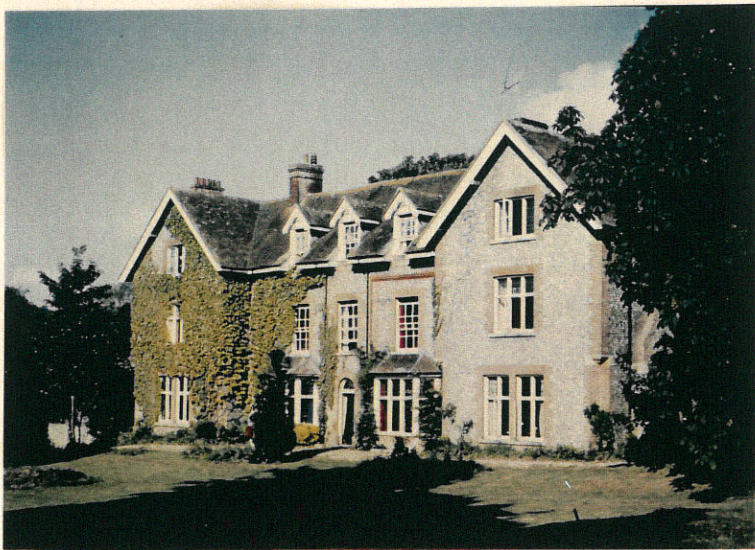
East Horden Youth Hostel