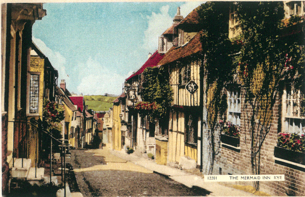
... Über Hlyth und Folkestone kamen wir nach Rye, ...