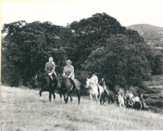
Riding in the New Forest

These new holidays are designed for those wishing to undertake a course of riding instruction. Here is an ideal opportunity to learn the technique of riding. Using a well-known stable with first-class facilities, parties will spend an enjoyable week learning much about riding and horse-management and coupling this with rides through the glades and open-country of the glorious New Forest. Suitable for the complete beginner and for those who wish to improve the knowledge they already have. Accommodation is at our Cranborne Youth Hostel.