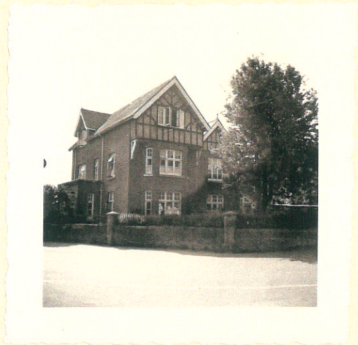
Cranborne Youth Hostel

These new holidays are designed for those wishing to undertake a course of riding instruction. Here is an ideal opportunity to learn the technique of riding. Using a well-known stable with first-class facilities, parties will spend an enjoyable week learning much about riding and horse-management and coupling this with rides through the glades and open-country of the glorious New Forest. Suitable for the complete beginner and for those who wish to improve the knowledge they already have. Accommodation is at our Cranborne Youth Hostel.